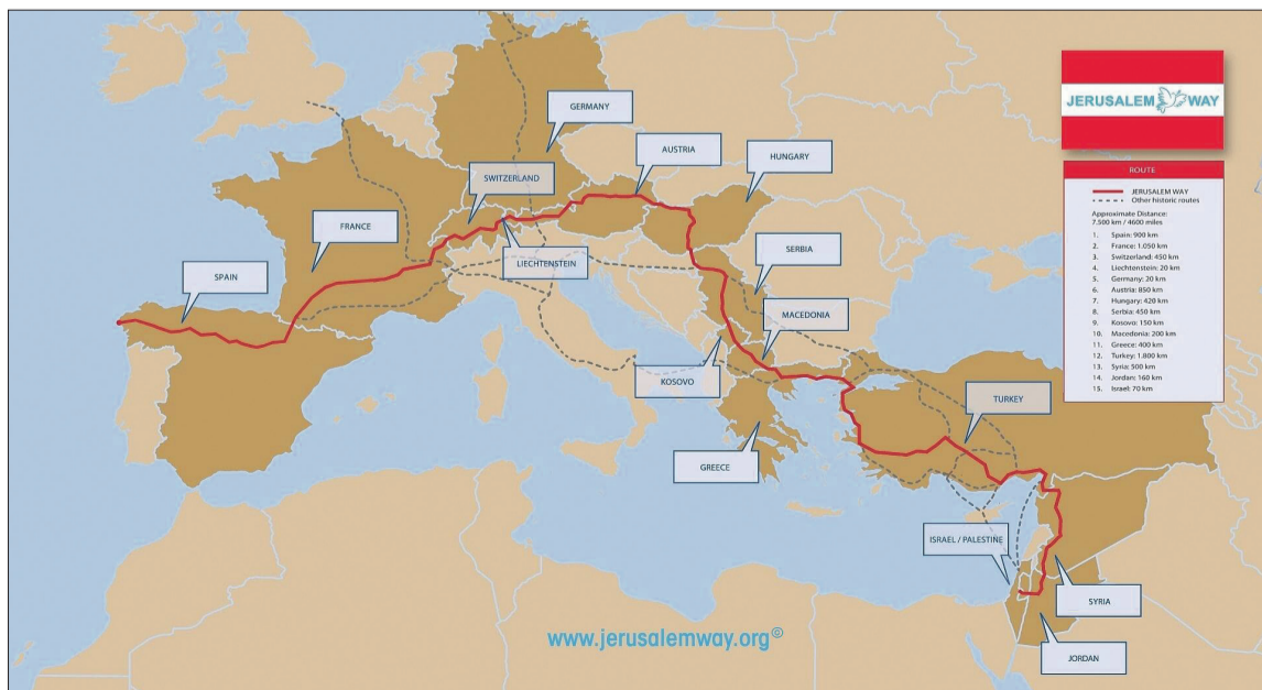
Die Route durch Prudnik soll in das Projekt JERUSALEM WAY / Jerusalemweg eingebunden werden.

Dies sind wahrscheinlich nicht alle Verbindungen zwischen Prudnik - Schlesien und dem Heiligen Land. In den alten Biogrammen der Bewohner unserer Region finden wir auch Erinnerungen an Pilgerreisen nach Jerusalem. ■